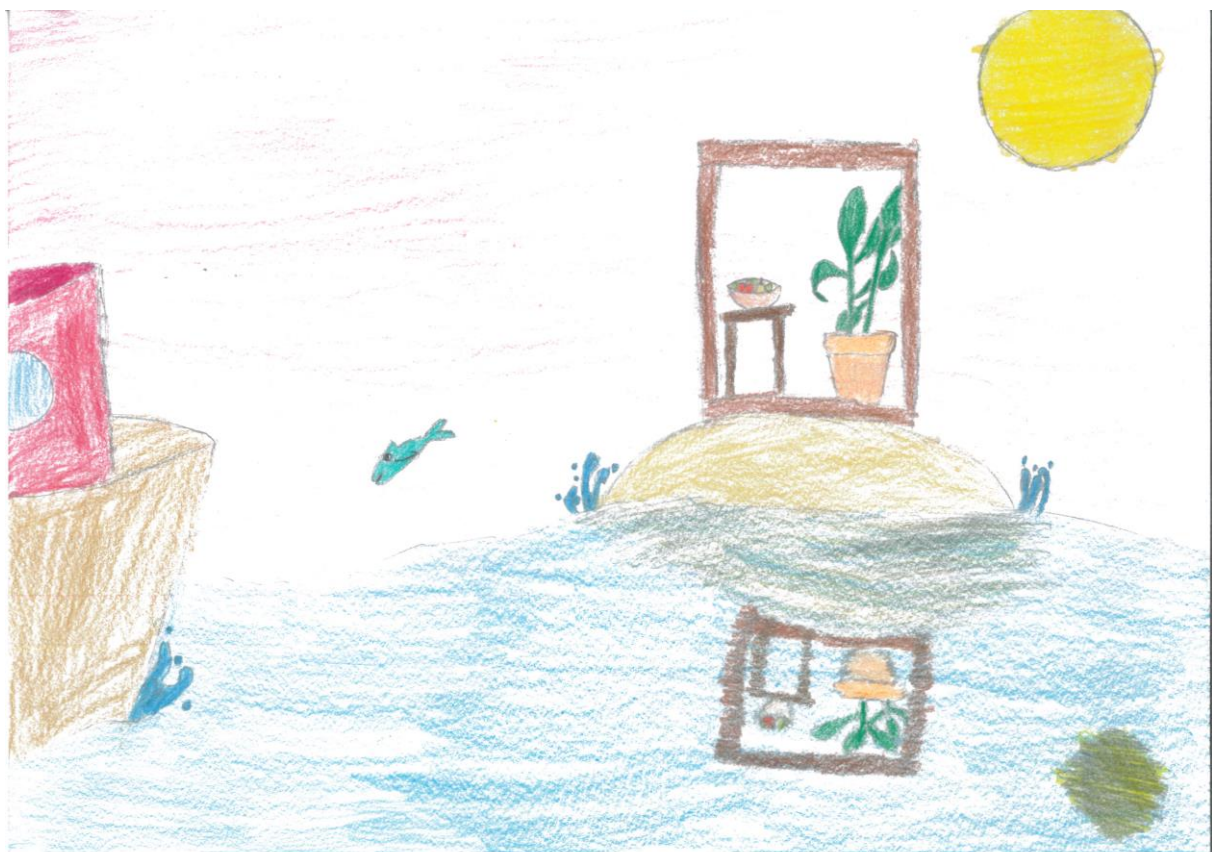
III. Algács Noémi- Bárdos Lajos Általános Iskola