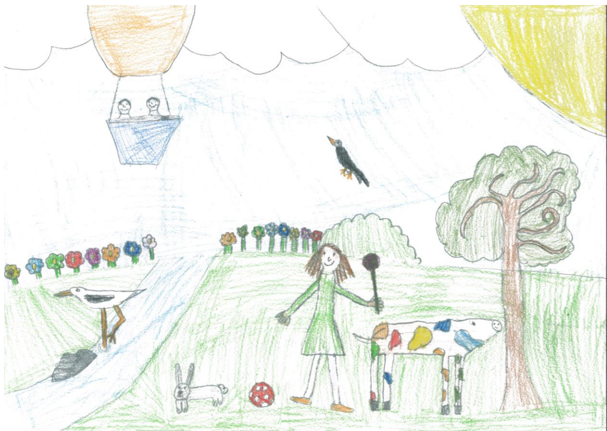
III. Múló Anita- Baross Gábor Általános Iskola