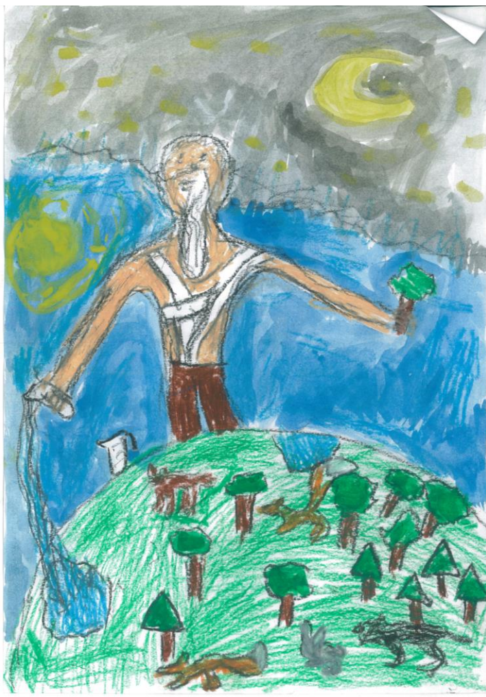
II. Zámberi Hanna Zsófia- Bárdos Lajos Általános Iskola