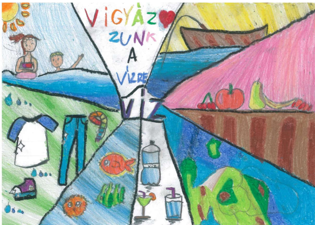
III. Holz Liliána Santál- Bárdos Lajos Általános Iskola