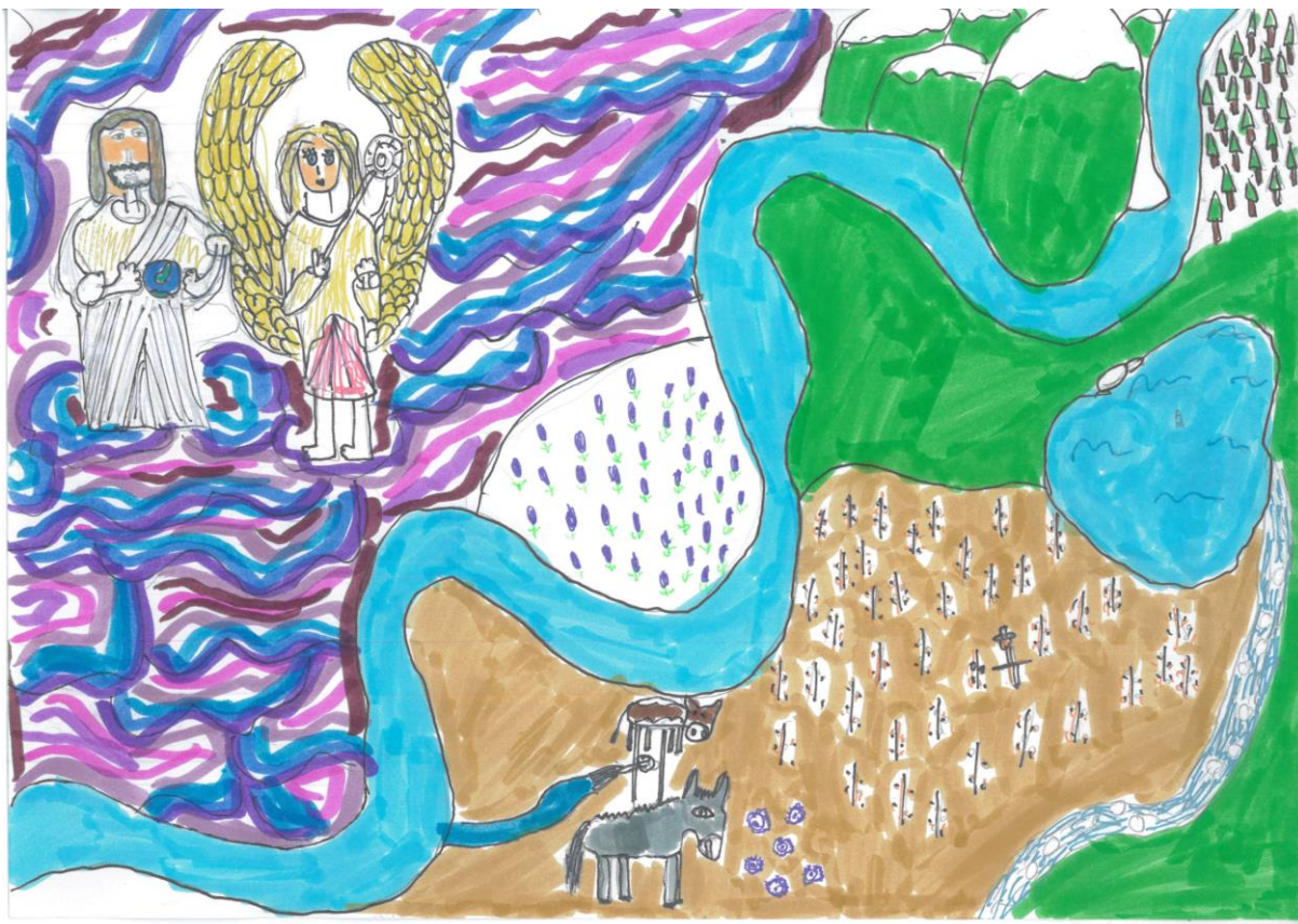
II. Horváth Emma- Bárdos Lajos Általános Iskola